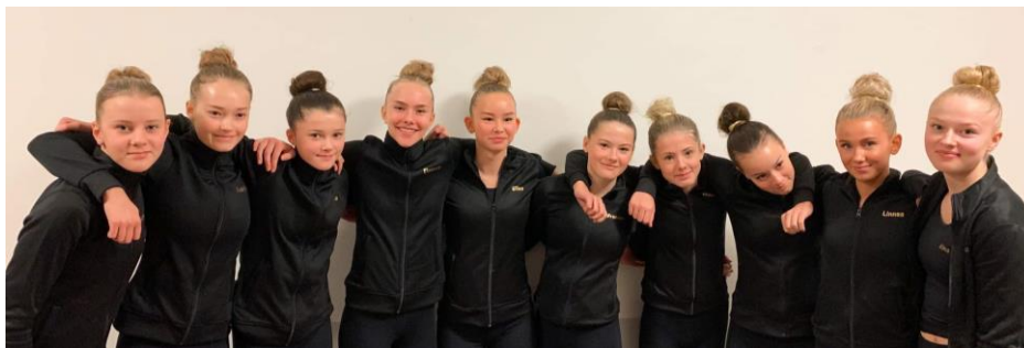
Äldretruppen tävlade på RiksFyran i Örebro 13-14/11.

Några tävlingar blev ändå av under 2021, trots pandemi. Trupperna Pojkar Silver, Trupp 11, Trupp 10, Trupp 13 och Yngre var under hösten iväg på olika mindre tävlingar.